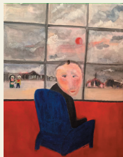
Aida Kebabian, sans titre, huile sur toile, 60x80 cm (c) Aida Kebabian

Invitation strictement privée, réservée aux amis des deux associations après inscription auprès de : contact@villamagdala.fr